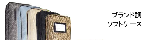
ブランド調 ソフトケース