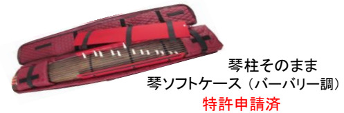
琴柱そのまま 琴ソフトケース (パーバリー調) 特許申請済