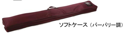
ソフトケース (パーバリー調)